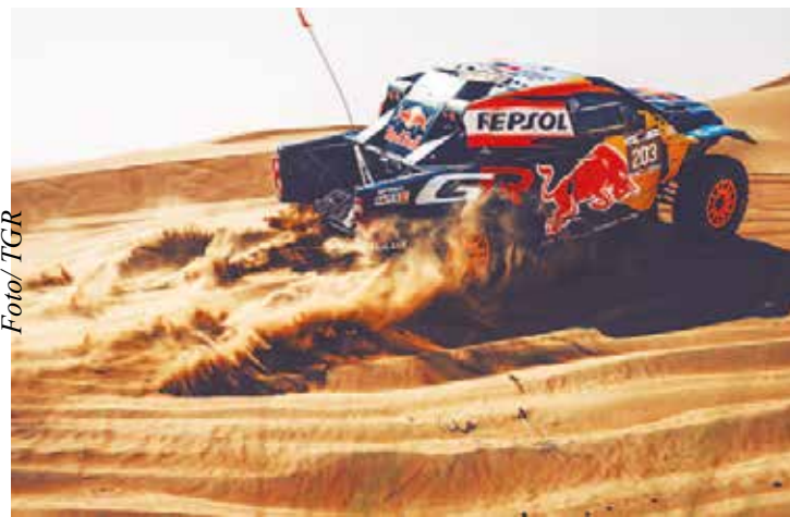
Lucas Moraes em ação: brasileiro teve dia de duelo com Sebastien Loeb

“Encontramos um bom ritmo” - “Estamos muito felizes com nosso desempenho”, disse Moraes. “Fizemos o segundo tempo no prólogo, vencemos no domingo a primeira es-