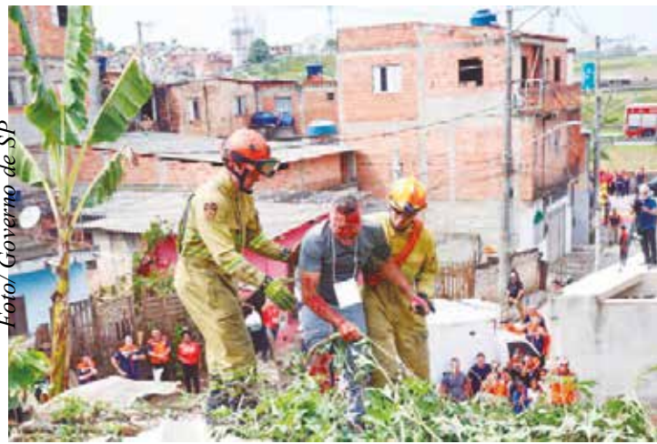
Para obtenção do apoio financeiro, municípios deverão ter decretos municipais de emergência ou calamidade publicados e reconhecidos pelo Governo de São Paulo.

O documento também estabelece instâncias de governança, tanto permanentes como tem-