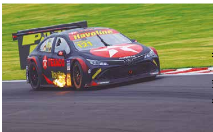
Etapa em Mogi Guaçu promete muitas emoções

Neste fim de semana (de 28 a 30 de junho) a Texaco Racing e seu piloto Felipe Baptista desembarcam juntos com a Stock Car no Autódromo Velocitta, em Mogi Guaçu, interior de São Paulo, para os desafios da quinta etapa da temporada 2024. Vale lembrar que antes da rodada 5, será realizada já nesta sexta-feira (dia 28) o complemento da segunda etapa, com