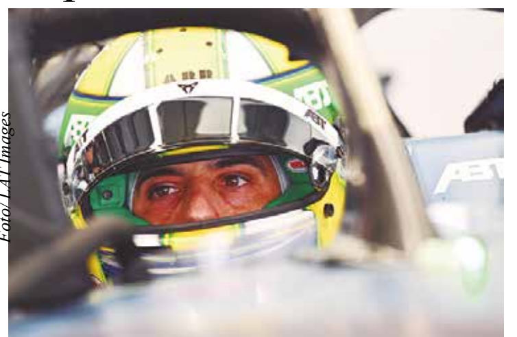
Lucas di Grassi espera corrida dinâmica em Portland

Lucas di Grassi está de volta ao volante dos carros do Campeonato Mundial de Fórmula E após quase um mês de “férias” da categoria, que fez uma pausa depois da rodada dupla em Xangai, na China. Neste fim de semana, entre os dias 28 e 30 de junho, o brasileiro da ABT Cupra vai acelerar no traçado do Portland International Raceway, nos Estados Unidos pelas etapas 13 e 14 da temporada.