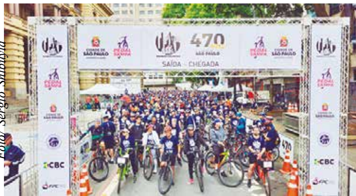
7ª Passeio Ciclístico Pedal Sampa - Virada ODS

No dia 23, após o término do passeio, serão sorteadas duas bi-