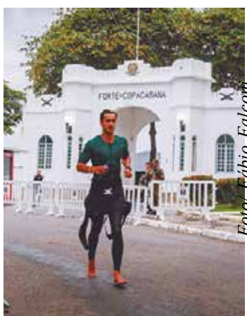
Itaú BBA IRONMAN 70.3 Rio de Janeiro

A programação oficial do Itaú BBA IRONMAN 70.3 Rio de Janeiro começou na quinta-feira, dia 20 de junho. A partir das 14h, será aberto o IRONMAN Village, mon-