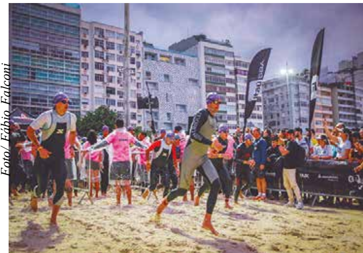
Itaú BBA IRONMAN 70.3 Rio de Janeiro

Itaú BBA IRONMAN 70.3 Rio de Janeiro inicia suas atividades na Cidade Maravilhosa