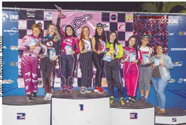
Festa das meninas do Mulheres em Ação