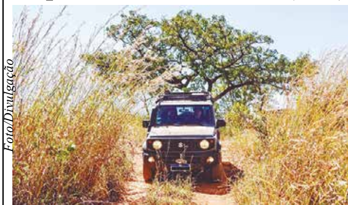
Suzuki Day terá ainda etapas em Gravatá (PE), Farroupilha (RS) e Miguel Pereira (RJ)

A cidade de Sabará, na Região Metropolitana de Belo Horizonte, capital mineira, recebe neste fim de semana, nos dias 22 e 23 de junho, a quarta etapa do passeio 4x4 Suzuki Day.